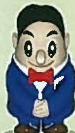
広島国税局キャラクター 広島主税(ちから)くん