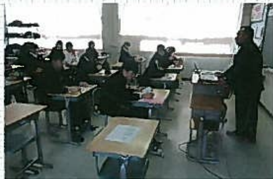
三次中学校 平成31年1月17日(木) 講師：二井