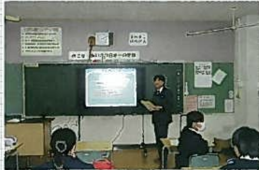
作木中学校 平成30年11月30日(金) 講師：吉川