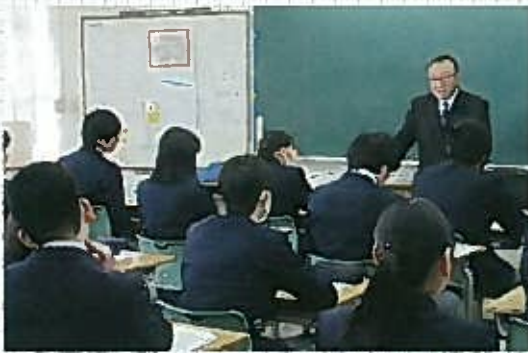
十日市中学校 平成30年12月12日(水) 講師：二井/藤川